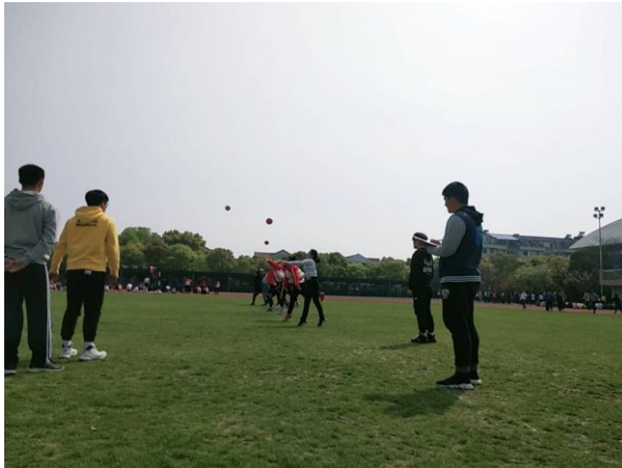
辅导学生练习助跑 前掷实心球！